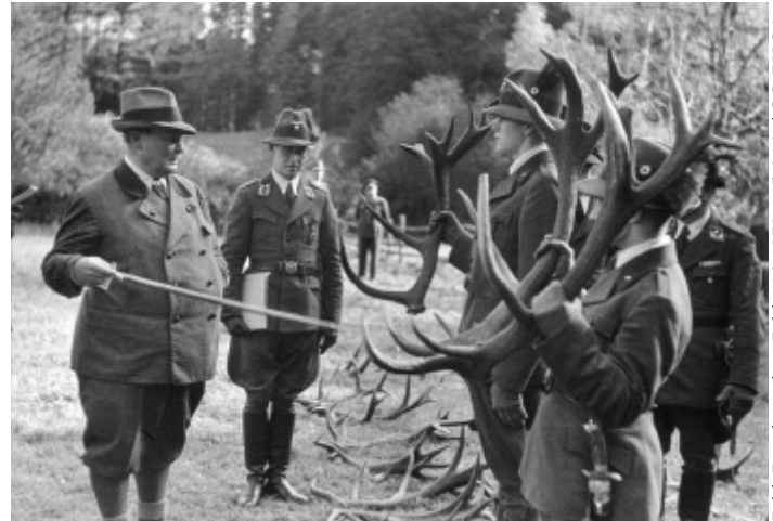
Hermann Göring auf der Jagd

Seither können Grundeigentümer einen Antrag stellen, dass ihre Flächen jagdrechtlich befriedet werden. So gibt es inzwischen die ersten offiziell jagdfreien Grundstücke in Deutschland.